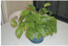
hiedra de potos

Las plantas siguientes contienen químicos que pueden afectar al corazón si se ingieren.