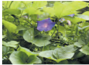
Dondiego de día (maravilla)

Hay un grupo grande y diverso de plantas venenosas, las cuales pueden causar una variedad de síntomas. Llame al Centro de Envenenamiento para información.