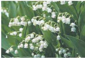
lirio de los valles

Algunas plantas podrían tener aceites o partes espinosas que causan una irritación de la piel. La irritación puede ser leve hasta severa.