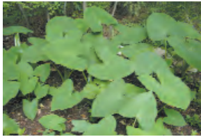
orejas de elefante